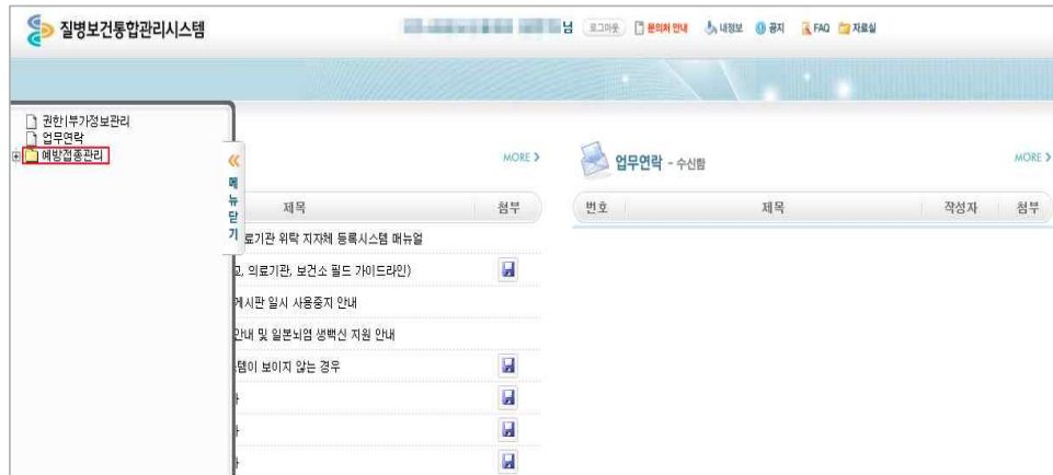
<그림 9. 예방접종관리 User 권한 승인 후 메뉴>