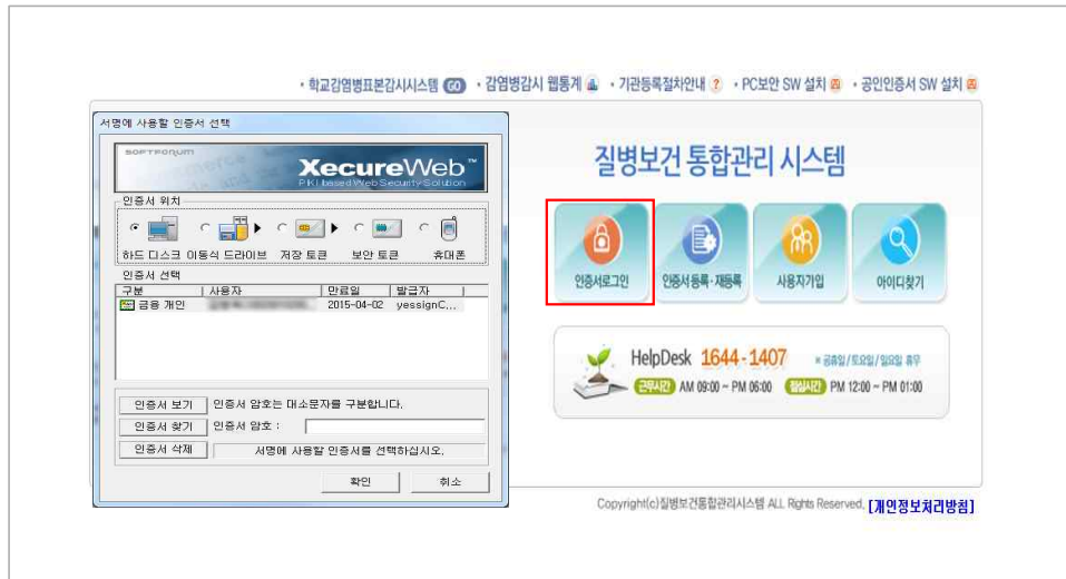
<그림 5. 질병보건통합관리시스템 로그인>