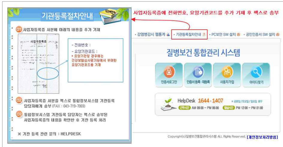
<그림 3. 기관등록절차 안내>