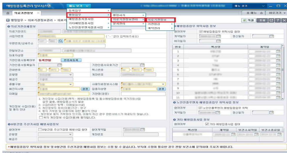
<그림 12. 의료기관 정보 위치>

- ‘행정업무’ > ‘의료기관정보관리’ > ‘의료기관정보’ 에서 의료기관의 기본정보를 확인하고 수정할 수 있습니다.