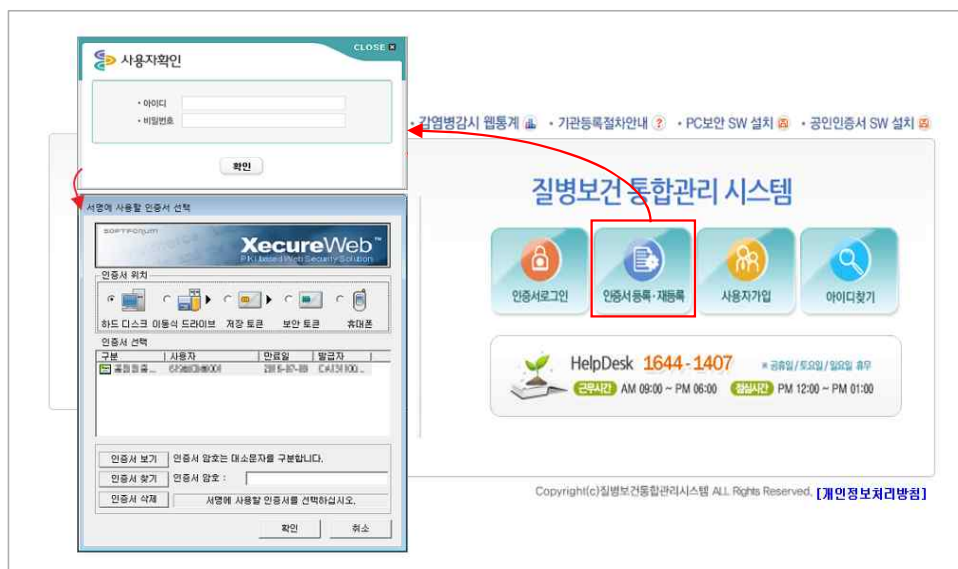
<그림 4. 질병보건통합관리시스템 인증서등록>