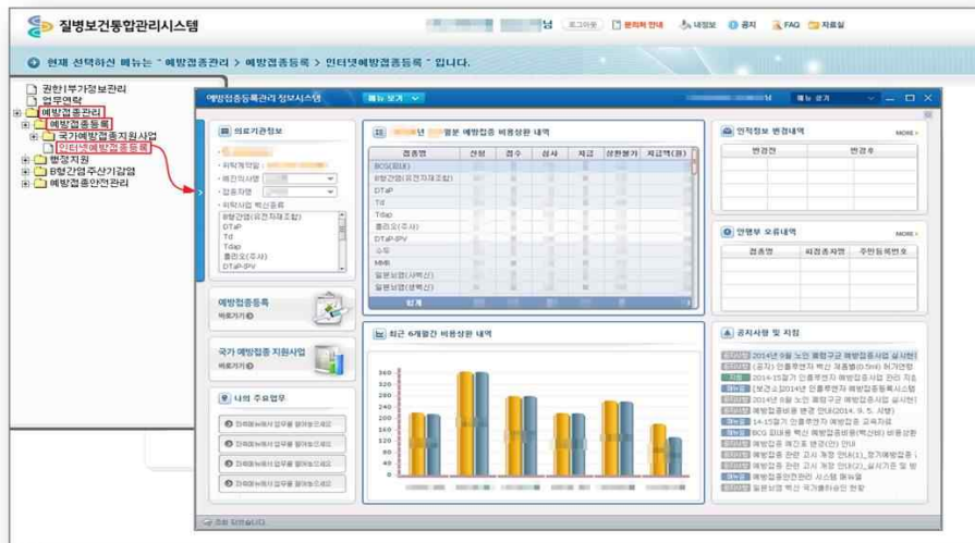
<그림 11. 예방접종등록관리 정보시스템 접속 화면>