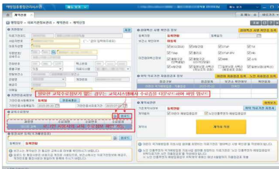
<그림 15. 의료기관 교육수료 정보 화면>

* 질병관리본부 교육시스템 사이트 : http://edu.cdc.go.kr