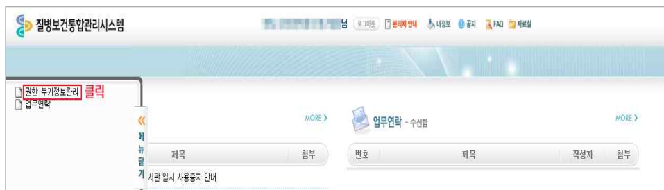
<그림 6. 예방접종관리 User 권한 신청(1)>