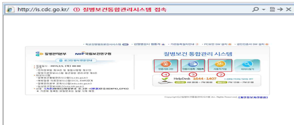
<그림 1. 질병보건 통합관리시스템 접속>

※ 사용자가입이 완료되면 로그인 후 관할 보건소로 예방접종관리 업무에 대한 사용자권한을 신청해야 '예방접종등록관리 정보시스템'을 사용할 수 있습니다.