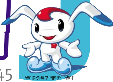
월미관광특구 캐릭터 '월디'