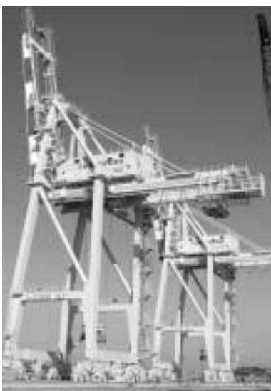
← 7일 중구 남항 선광컨테이너터미널에 모습을 드러낸 30m 높이의 대형 컨테이너 트레인 2기가 위용을 뽐내고 있다.