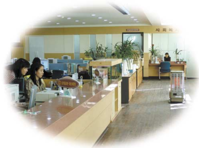
연안동사무소 산뜻한 리모델링 주민 '호응'