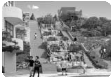
도원동 70계단일원 정비공사 투시도

중구 관계자는 “도원동 70계단 정비계획은 마을주민들이 함께하는 열린공간, 마을을 대표하는 상징적인 외부공간, 놀이와 건강증진에 도움을 주는 다기능 공간을 만들어가는 과정”이라며 “올 해 안에 확 달라지게 되는 도원동의 모습을 기대해도 좋다”이라고 말했다.