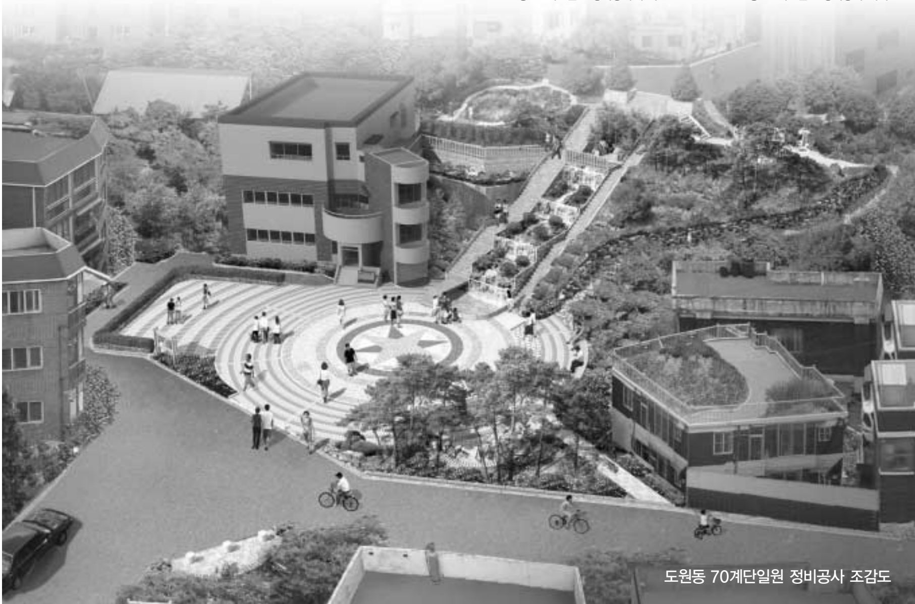
도원동 70계단일원 정비공사 조감도