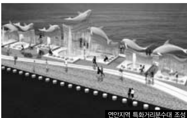
연안지역 특화거리분수대 조성

예나 지금이나 측후소처럼 일반 시민과 관련이 없는 고고한 관청은 없을 것이나, 인천관측소만은 하나의 예외였던 시절이 있었다. 한 때 제고 자리가 공설운동장이어서 모여드는 많은 시민이 가까이서 볼 수 있었고 1906년부터 근 4반세기 동안 정오를 알리는 산포(山砲)공탄을 발사했기 때문이다. 당시에는 오폭(午砲)산이란 이름이 관측소 산보다 널리 통하고 있었다.