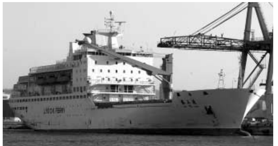
인천-렌윈강 항로에 투입된 '자옥란' 호

특히 그 동안 상하이(上海)와 쑤저우(蘇州) 등 장쑤(江蘇)성 지역에 진출한 국내 기업들의 미주, 유럽으로 향하는 수출화물이 18시간의 육상운송 과정을 통해 산둥(山東)성 지역 항만을 거쳐 인천항-인천국제공항으로 연결되는 해상항공연계(Sea & Air)화물이 렌윈강을 통해 상당