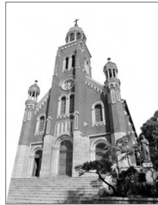
〈답동성당〉 위치: 인천광역시 중구 답동

인천의 한복판 중구 답동 언덕에 우뚝 솟은 인천 답동성당은 인천 시민들과 온갖 풍상을 함께 겪으며 동고동락해 온 인천의 산증인이다.