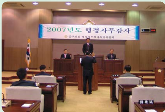
행정사무감사 특별위원회 활동

몽골 수흐바타르 바트호약 의장 외 7명이 인천광역시중구의회를 방문하여 양 도시 의회 간의 우호 증진 및 교류 · 협력방안을 논의하고 환담했다. 이승언 의장은양 도시간에 행정, 문화, 환경 등 다양한 분야에서 활발한 교류와 협력을 통해 돈독한 관계를 더욱 공고히 다지는 계기가 되길 바란다 하고, 수흐바타르 바트호약 의장은 앞으로 상호 간 성공적인 정책 또는 행정경험을 교환하는 등 두 도시 발전에 실질적으로 기여할 수 있도록 의회 차원의 노력을 다하자고 말했다. 또한 수흐바타르 대표단은 중구의회 본회의장 및 한중문화관 · 항만시설등 주요 도시기반시설을 방문하여 관리 · 운영실태를 비교 시찰했다.