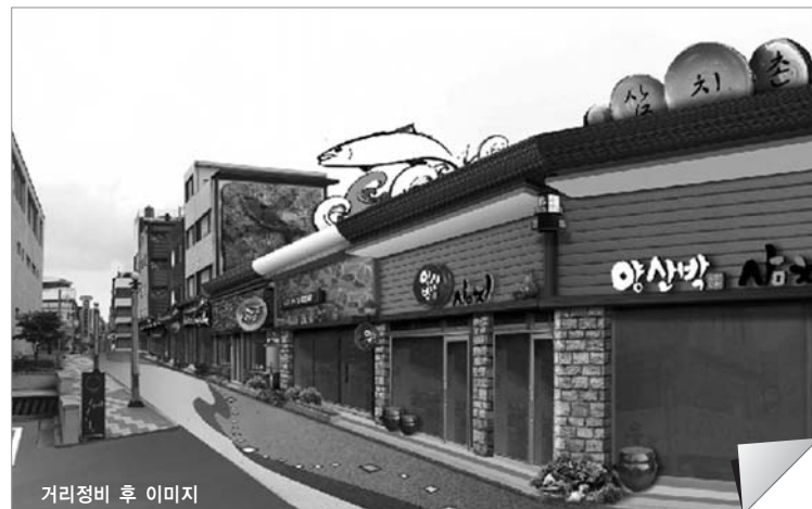
거리정비 후 이미지

다정감이 있는 추억의 거리와 바다를 닮은 꿈의 거리를 만들고자 하는 구상으로 동인천역 인천항·월미도방향 우현로 700m를 조성하게 되며, 행자부 공모결과 후 삼치거리 70m가 추가될 예정이다.