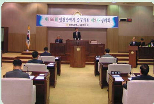
제166회 제2차 정례회 개최

인천광역시중구의회(의장:이승언)는 지난 11월 26일부터 12월14일까지 19일간의 일정으로 제166회 제2차 정례회를 개최했다. 이번 정례회에서는 중구청장의 시정연설의견, 중기지방 재정계획보고의견이 있었으며, 2008년도 예산안 심의건, 2008년도 기금운용계획안, 2007년도 행정사무감사 실시건, 2007년 제2회추경예산안, 2008년도 공유재산 관리계획의견 및 조례안(11건) 등을 각 특별위원회에서 심의하여 작성된 행정사무감사결과보고서 및 예산안을 원안 및 수정 의결했다.