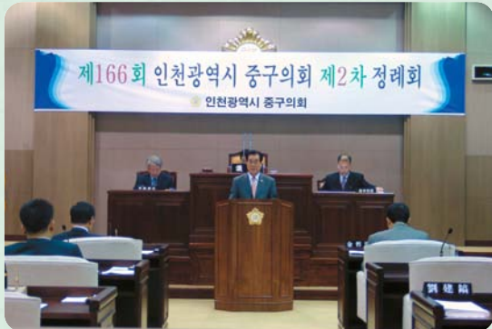
인천광역시중구 21세기발전위원회 설치 및 운영 조례안 발의

인천광역시중구의회(의장:이승언)는 지난 11월 26일부터 12월14일까지 19일간의 일정으로 제166회 제2차 정례회를 개최했다. 이번 정례회에서는 중구청장의 시정연설의견, 중기지방 재정계획보고의견이 있었으며, 2008년도 예산안 심의건, 2008년도 기금운용계획안, 2007년도 행정사무감사 실시건, 2007년 제2회추경예산안, 2008년도 공유재산 관리계획의견 및 조례안(11건) 등을 각 특별위원회에서 심의하여 작성된 행정사무감사결과보고서 및 예산안을 원안 및 수정 의결했다.