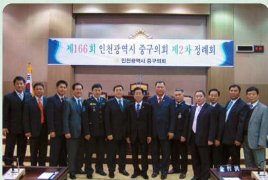
몽골 수흐바타르 대표단 방문

몽골 수흐바타르 바트호약 의장 외 7명이 인천광역시중구의회를 방문하여 양 도시 의회 간의 우호 증진 및 교류 · 협력방안을 논의하고 환담했다. 이승언 의장은양 도시간에 행정, 문화, 환경 등 다양한 분야에서 활발한 교류와 협력을 통해 돈독한 관계를 더욱 공고히 다지는 계기가 되길 바란다 하고, 수흐바타르 바트호약 의장은 앞으로 상호 간 성공적인 정책 또는 행정경험을 교환하는 등 두 도시 발전에 실질적으로 기여할 수 있도록 의회 차원의 노력을 다하자고 말했다. 또한 수흐바타르 대표단은 중구의회 본회의장 및 한중문화관 · 항만시설등 주요 도시기반시설을 방문하여 관리 · 운영실태를 비교 시찰했다.