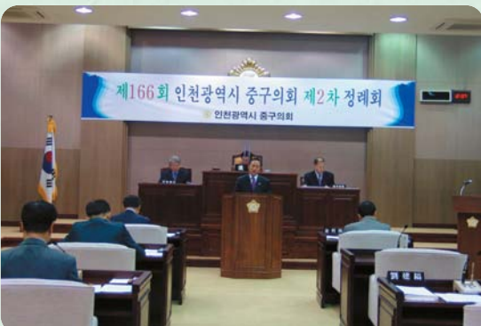
인천광역시중구 출산양육지원금 지원 조례안 발의

인천광역시중구의회 예산결산특별위원회(위원장:김환)는 지난 11월 26일부터 9일간 걸쳐 2008년도 일반 및 특별회계세입세출예산안, 2008년도 기금운용계획안, 2007년 일반 및 특별회계 제2회추가경정예산안 등 예산안을 원안 및 수정 의결했다.