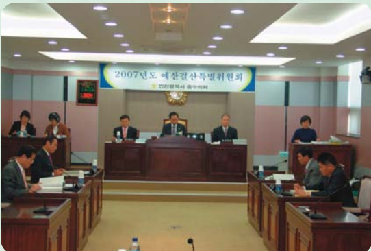
예산결산 특별위원회 활동

인천광역시중구의회 예산결산특별위원회(위원장:김환)는 지난 11월 26일부터 9일간 걸쳐 2008년도 일반 및 특별회계세입세출예산안, 2008년도 기금운용계획안, 2007년 일반 및 특별회계 제2회추가경정예산안 등 예산안을 원안 및 수정 의결했다.