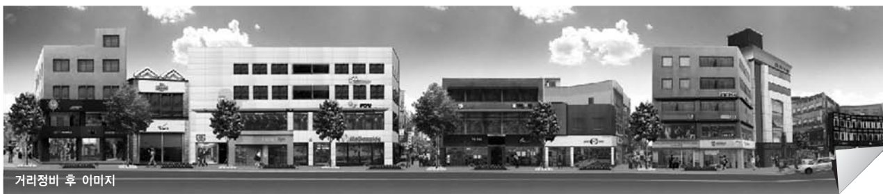
거리정비 후 이미지

간판 시범거리로 인해 동인천역 주변의 크고 많은 혼란스런 간판으로부터 주민의 거리주권을 회복시켜 삶의 질을 향상시키고 민관 협의체 참여 활동을 통한 시민의 공동체 의식을 함양하는 등 선진 시민 의식 고취와 지역 관광 및 경제활성화에 기여할 것으로 기대한다.