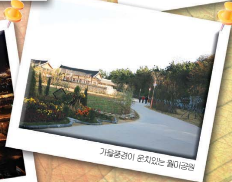
가을풍경이 운치있는 월미공원