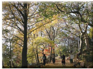
사진촬영 명소 자유공원

붉게 물든 단풍, 노란 은행잎과 함께 가을 분위기가 붉게물든 운치있는 자연의 아름다움을 느낄수 있는 곳으로 추억의 카메라를 들고 떠나자~