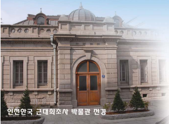
인천한국 근대최초사 박물관 전경