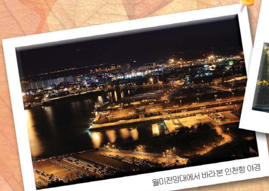
월미천앞대에서 바라본 인천항 야경