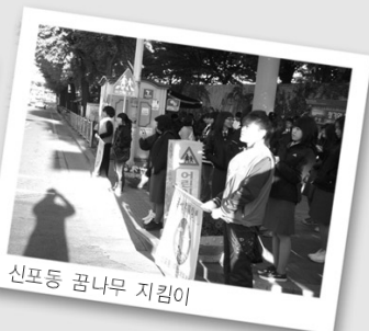
신포동 꿈나무 지킴이