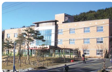
운북동 752-79번지 구립 해송 노인요양원