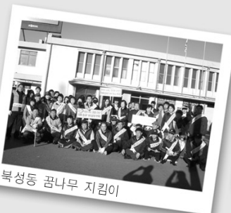
북성동 꿈나무 지킴이

앞으로 주민자치센터에서는 지속적인 캠페인 참여를 통하여 꿈나무지킴이 사업의 참된 의미를 되새기고 어린이가 행복하고 안전한 도시를 만들기 위해 노력할 방침이다.