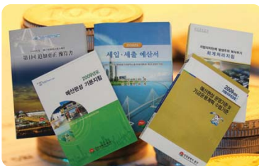
효율적인 예산 집행