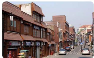
중구청 앞 역사문화의 거리

인천광역시 중구(구청장 박승숙)가 2008년 전국 지방자치단체 경쟁력 평가 결과 지방 자치 경쟁력이 가장 뛰어난 지역으로 평가 되었다. (사)한국공공자치연구원(원장 : 정세욱)에서 전국 230개 기초지방자치단체를 대상으로 인적자원,