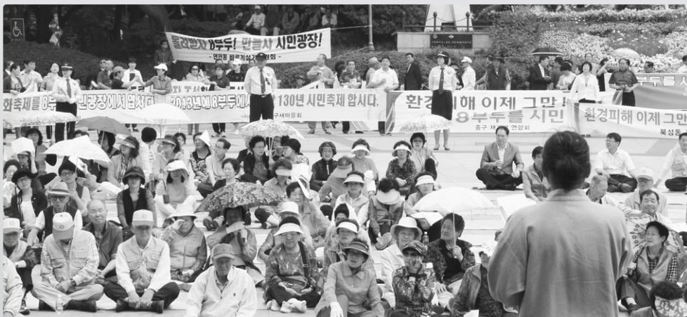
광장 조성계획이 발표되도록 최선을 다하겠다.”고 말했다.

인천내항8부두 시민광장조성운동 선포식이 5월 29일 자유공원광장에서 2,000여명의 주민이 참석한 가운데 성황리에 개최됐다.