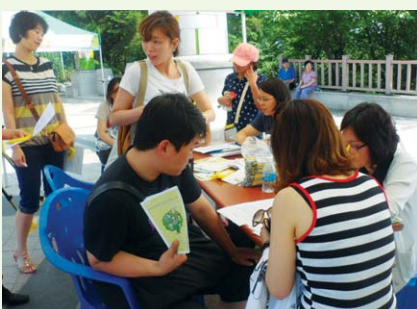
길거리 이동상담 캠페인