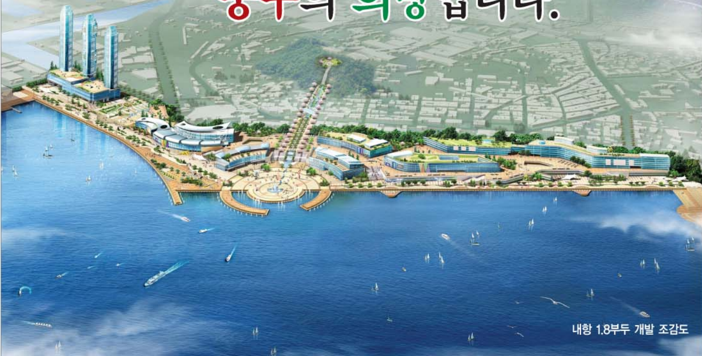
내항 1.8부두 개발 조감도

내항 8부두 하루 빨리 개방해야 합니다. 산업발전의 전진기지로써 국가와 항만업계가 비약적인 발전을 이뤘다면 이제 그 발전의 결실을 돌려받아야 하는 것이 당연합니다. 마침 창조정책이 강조되는 시대의 흐름에 부응해 주민들의 삶의 질 향상에 기여하는 복합 친수공간으로 하루속히 재창조되어야 합니다.