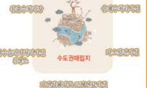
수도권매립지내 환경오염 시설