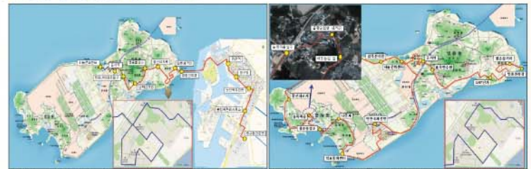
5번 노선 (운서역-중구청-중구문화센터) 2번 연장 (영종선착장-하늘문화센터-왕산해수욕장)

※ 영종·용유 노선조정위원회(11월초) 심의 완료 후 운행예정임으로 운행경로의 변경이 있을 수 있음