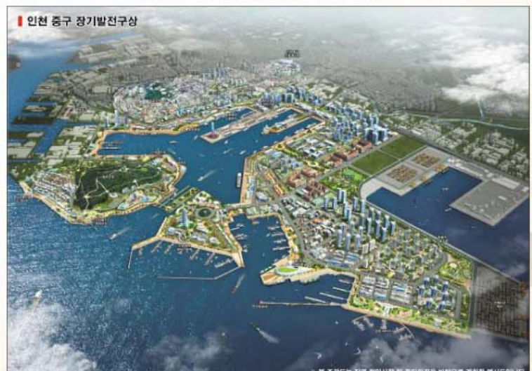
※ 본 조감도는 지역 주민사항 및 주민의견을 바탕으로 계획한 예시도입니다.

앞으로 내항 1·8부두 재개발로 개항장문화지구, 차이나타운, 자유공원, 월미도에 이르는 「월미관광특구」와 도시재생사업이 연계되어 친수·문화·복합공간이 새로이 조성됨에 따라 주거환경 개선과 관광 및 지역경제 활성화에 크게 기여할 것으로 기대된다.