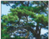
나무 / 해송