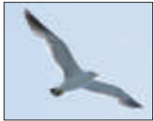
새 / 갈매기