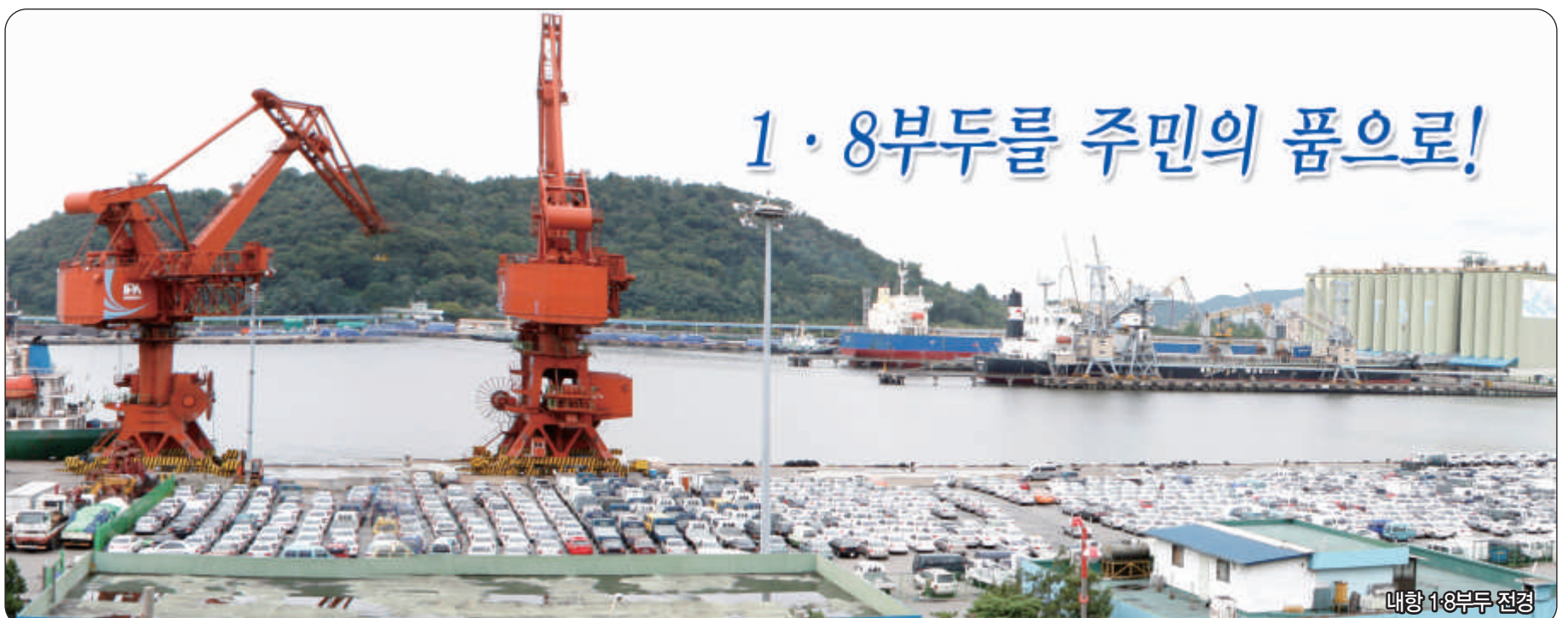
내항 1·8부두 전경