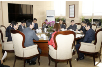
[ 쪽방촌 희망 나눔 집고치기 기업 간담회 개최 (2015.1.7) ]