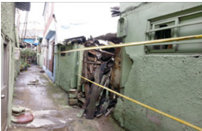
[ 쪽방촌 모습 ]