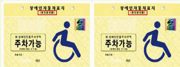
장애인주차구역 주차가능 표지 예시