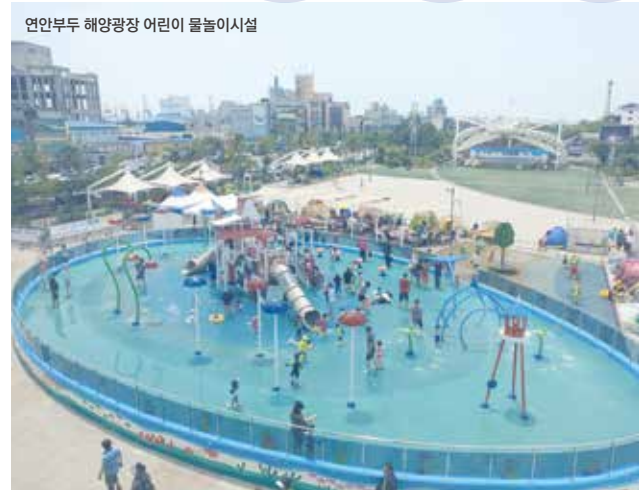
연안부두 해양광장 어린이 물놀이시설