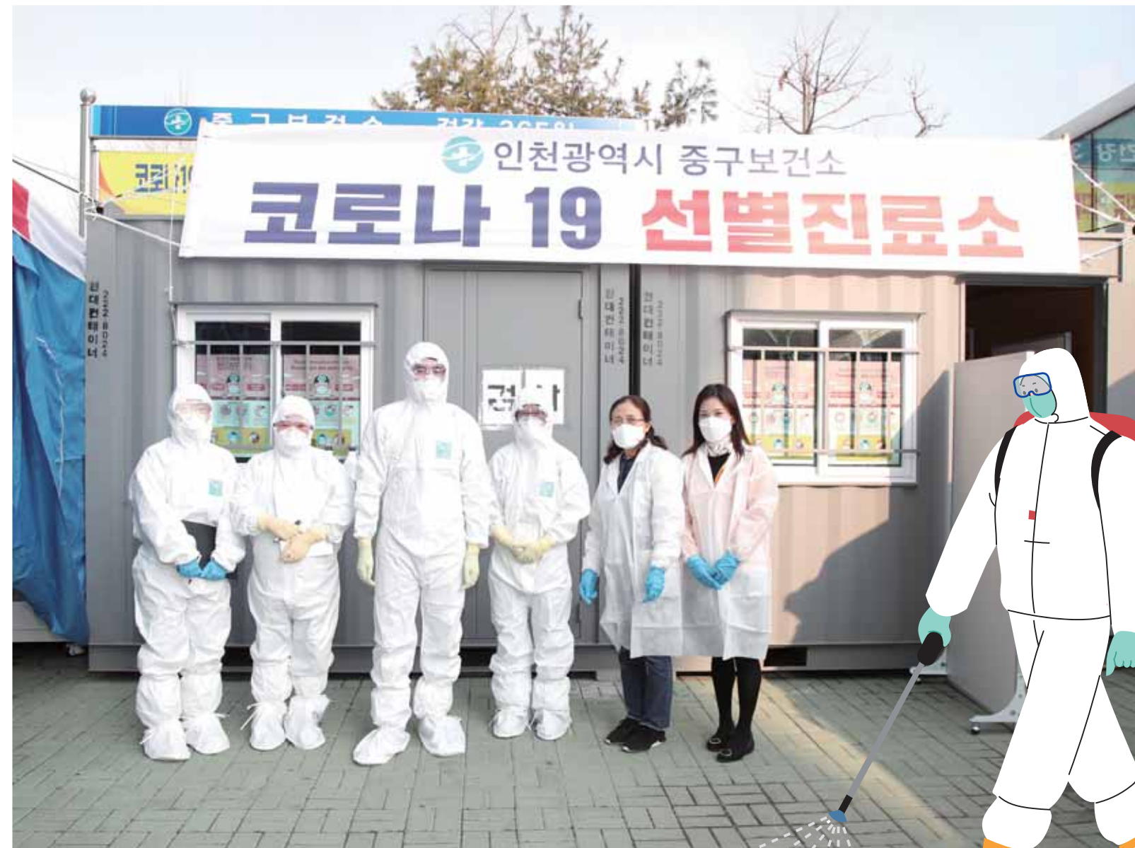
중구보건소 코로나19 선별진료소