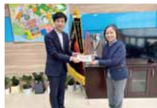
영종1동 하나로교회 성금기금