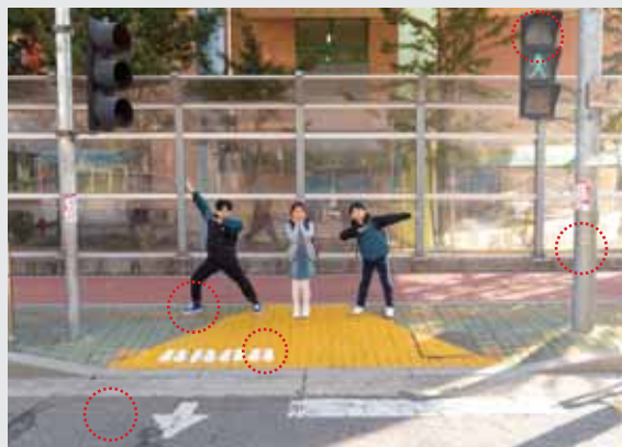
지난 호 퀴즈 정답

3월 31일(화)까지 기프티콘(아메리카노 2잔)을 보내드립니다. 연락처를 꼭 남겨주세요!^^