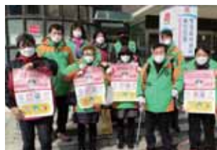
인천중구자원봉사센터 & 인천중구자율방재단