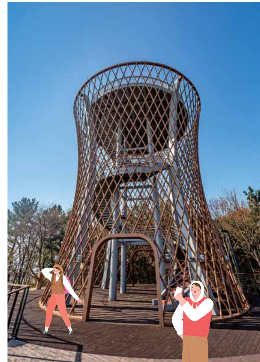
용유 하늘전망대 위치 중구 덕교동 128-48번지

전망대 정상에서는 노적봉, 왕산, 백운산, 인천국제공항 등과 매도랑, 사렴도, 호룡곡산, 무의대교 등의 해안도시 경관을 한 눈에 담을 수 있다. 전망대 정상에 올라 시원한 바람을 느끼며 바라본 풍경은 잊지 못할 추억을 선사한다. 해질 무렵에 방문하면 노랗게 빛나는 태양이 주황빛 석양을 보이며 지는 아름다운 일몰을 볼 수 있다. 해가 완전히 지고 어둠이 내리면 전망대의 또 다른 모습을 볼 수가 있다. 전망대를 둘러싼 경관조명이 화려하게 켜지며 멋진 야경을 선물하기 때문이다. 어두운 밤, 환하게 빛나는 전망대는 멀리서도 한눈에 찾을 수 있어 랜드마크 역할도 한다. 2020년이 얼마 남지 않은 이 시점, 용유 하늘전망대에 올라 올해의 아쉬움을 훌훌 날려버리며 2021년 새해의 목표를 다짐을 해보는 건 어떨까. 아름다운 풍경이 밝고 힘찬 기운을 선물할 것이다.