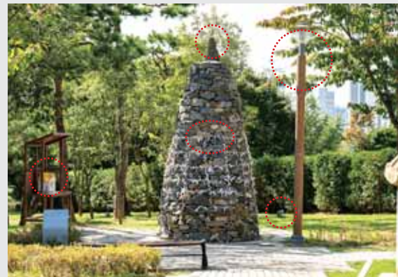
지난 호 퀴즈 정답