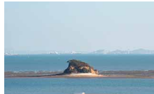
전망대에서 바라본 ‘매도랑’

전망대 정상에서는 노적봉, 왕산, 백운산, 인천국제공항 등과 매도랑, 사렴도, 호룡곡산, 무의대교 등의 해안도시 경관을 한 눈에 담을 수 있다. 전망대 정상에 올라 시원한 바람을 느끼며 바라본 풍경은 잊지 못할 추억을 선사한다. 해질 무렵에 방문하면 노랗게 빛나는 태양이 주황빛 석양을 보이며 지는 아름다운 일몰을 볼 수 있다. 해가 완전히 지고 어둠이 내리면 전망대의 또 다른 모습을 볼 수가 있다. 전망대를 둘러싼 경관조명이 화려하게 켜지며 멋진 야경을 선물하기 때문이다. 어두운 밤, 환하게 빛나는 전망대는 멀리서도 한눈에 찾을 수 있어 랜드마크 역할도 한다. 2020년이 얼마 남지 않은 이 시점, 용유 하늘전망대에 올라 올해의 아쉬움을 훌훌 날려버리며 2021년 새해의 목표를 다짐을 해보는 건 어떨까. 아름다운 풍경이 밝고 힘찬 기운을 선물할 것이다.