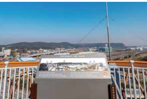
푸른 하늘아래 펼쳐진 영종국제도시 풍경

매년 1월 1일이 되면 많은 사람들이 수평선 너머 밝게 떠오르는 일출을 보기 위해 중구를 찾는다. 중구는 구민을 포함한 많은 사람들이 편안하고 안전하게 일출과 석양을 바라볼 수 있도록 ‘용유 하늘전망대’를 건립했다. 주황빛으로 아름답게 지는 석양과 밝고 힘차게 떠오르는 일출을 볼 수 있는 용유 하늘전망대를 찾아가보자. 황홀하게 빛나는 자연이 기다리고 있다.