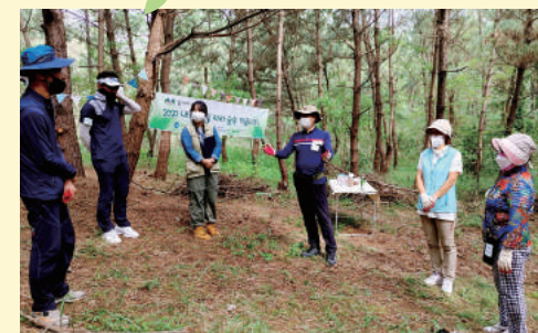
중산동 공동체_꿈따라 바다로