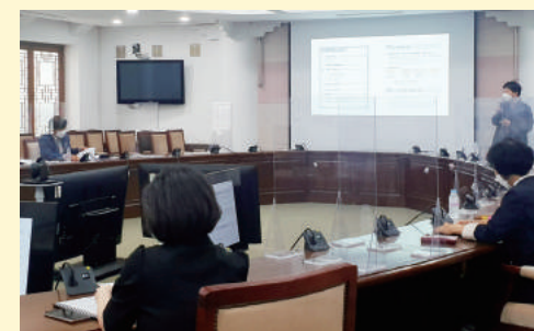
2021년 마을공동체 회계교육