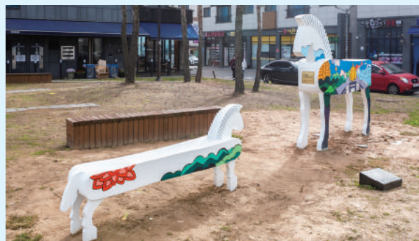
운서동 공공미술 프로젝트