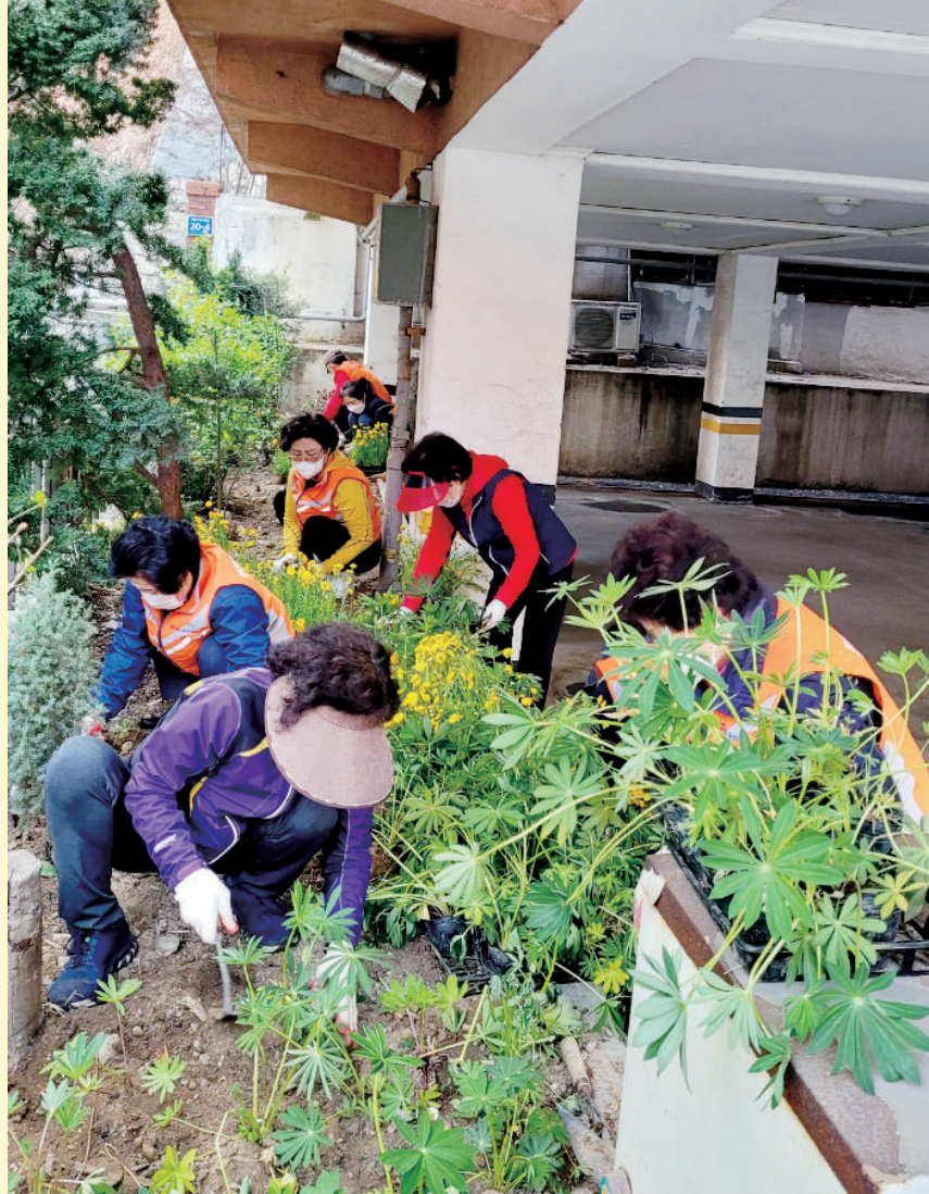
울목동 공동체_구석구석 울목통

+ 마을공동체는 주민들이 모여 마을에 관한 일이나 필요한 활동을 직접 결정하고 실천하는 모임이다. 중구는 마을공동체를 도와 주민이 활기찬 마을을 조성하기 위해 ‘2021년 마을공동체 만들기 지원사업’을 실시하고 있다.