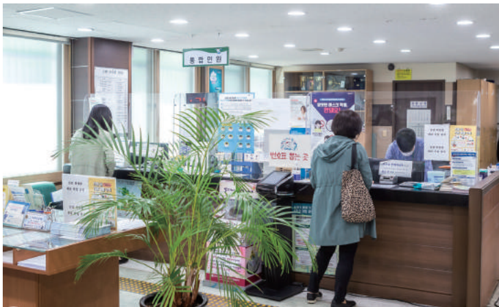
신포동 행정복지센터 ☎ 760-6100

신포동은 개항의 시간을 고스란히 간직한 공간이다. 신포동 행정복지센터는 신포동의 문화를 보존하고 지역 곳곳에 활력을 불어넣는 다양한 사업을 추진 중이다. 예스러움의 고고함과 거리를 밝히는 꽃길의 향기로움이 한데 어우러져 오늘의 신포동을 더욱 화사하게 물들인다.