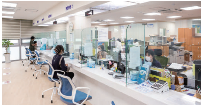
영종행정복지센터 ☎ 760-8880

도농복합형은 도시와 농촌의 지역이 통합된 형태를 말한다. 영종동은 농촌과 어촌은 물론 새롭게 개발된 도시까지 다양한 주거환경의 성격을 지녔다. 영종동 행정복지센터는 마을이 조화롭게 발전하고 주민의 삶이 더 편안하도록 여러 서비스를 제공하고 있다.