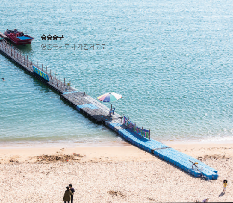
승승중구 영종국제도시 자전거도로