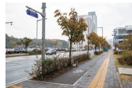
구읍베타 부근 자전거도로

영종국제도시 라이딩은 보통 구읍베타에서 시작된다. 공항철도 내 자전거 휴대 승차가 주말만 가능하기 때문이다. 구읍베타에서 바다 냄새를 한껏 맡으며, 자전거도로를 따라가다 보면 씨사이드파크에 다다른다. 여기서부터 이어지는 영종해안남로 구간까지는 편하게 달릴 수 있는 곧게 뻗은 길이다. 용유역에서는 코스가 두 가지로 나뉜다. 먼저 왕산, 을왕리 등 시원한 풍광을 바라보며 달리는 해변 길이다. 다른 코스는 무의대교를 건너 무의도를 둘러보는 길이다. 마지막은 영종해안북로 구간으로 현재는 자전거의 출입이 제한된다. 공사가 마무리되면 아름다운 풍경과 정취를 느끼며 쾌적하게 달릴 수 있는 라이딩 길이 될 것으로 기대된다.