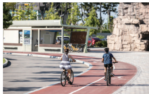
씨사이드파크 내 자전거도로