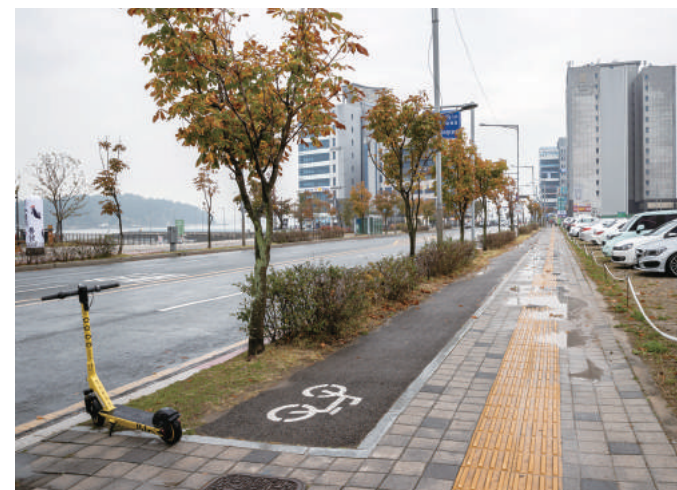
구읍벡터 부근 자전거도로

영종국제도시 자전거도로는 다채롭다. 바다를 따라 달리는 코스부터 푸른 녹음 속을 달리는 길까지 영종국제도시 구석구석을 자전거로 둘러보자.