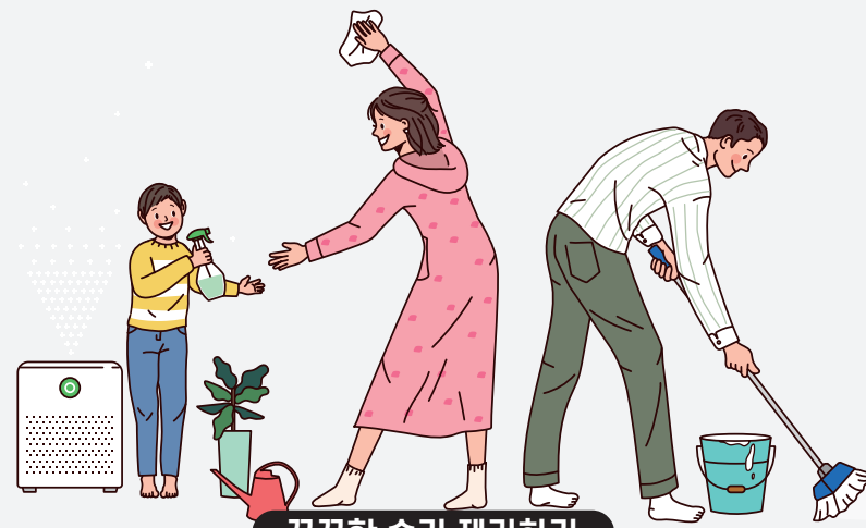
뽀뽀한 습기 제거하기

여름철엔 높은 온도와 습도로 다양한 불청객이 찾아온다. 습기와 곰팡이 그리고 각종 벌레다. 그래서 준비했다. 여름을 쾌적하게 보낼 수 있는 유용한 생활 정보.