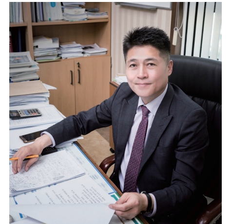
민선8기 중구청장 김정현

민선 8기, 중구를 새롭게 이끌어갈 김정현 구청장. 그동안 중구의 발전을 위해 노력했던 경험과 노하우를 바탕으로 산적한 지역의 현안을 해결해 나가고자 한다. 당선의 기쁨을 누리기보다 중구의 새로운 도약을 위해 바쁘게 준비하고 있는 그의 이야기를 들어보자.