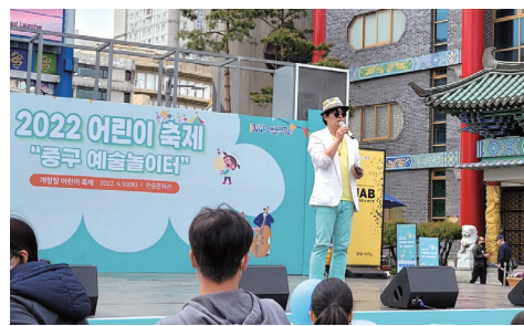
2022 어린이 축제 '중구 예술놀이터'

공동소유, 민주적 운영을 통해 경제적, 사회적, 문화적 필요와 욕구를 이루려는 사람들의 자발적인 결성 조직으로 주민의 권익·복지 증진 활동을 수행하거나 취약계층에게 사회 서비스를 제공한다.