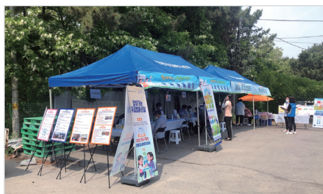
찾아가는 이동 복지센터