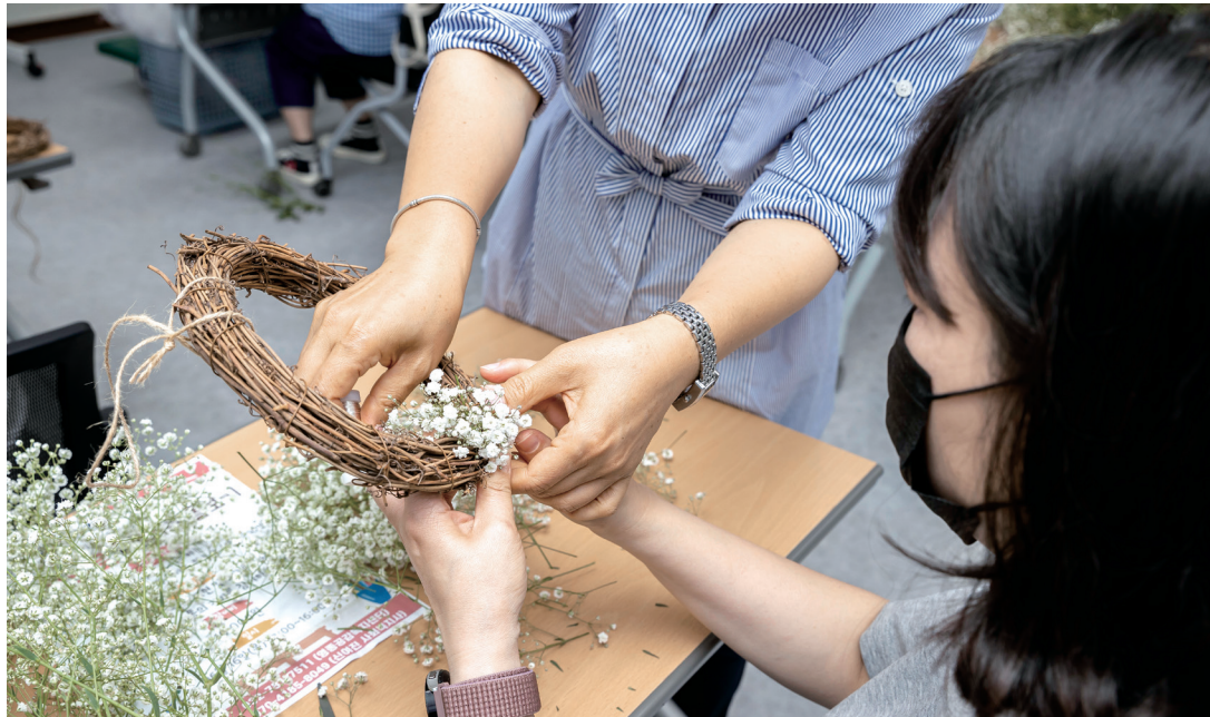
성인기능교실 생화(플라워) 클래스

청운대학교 산학협력단 운영 영종공감복지센터 Yeongjong Empathy Welfare Center