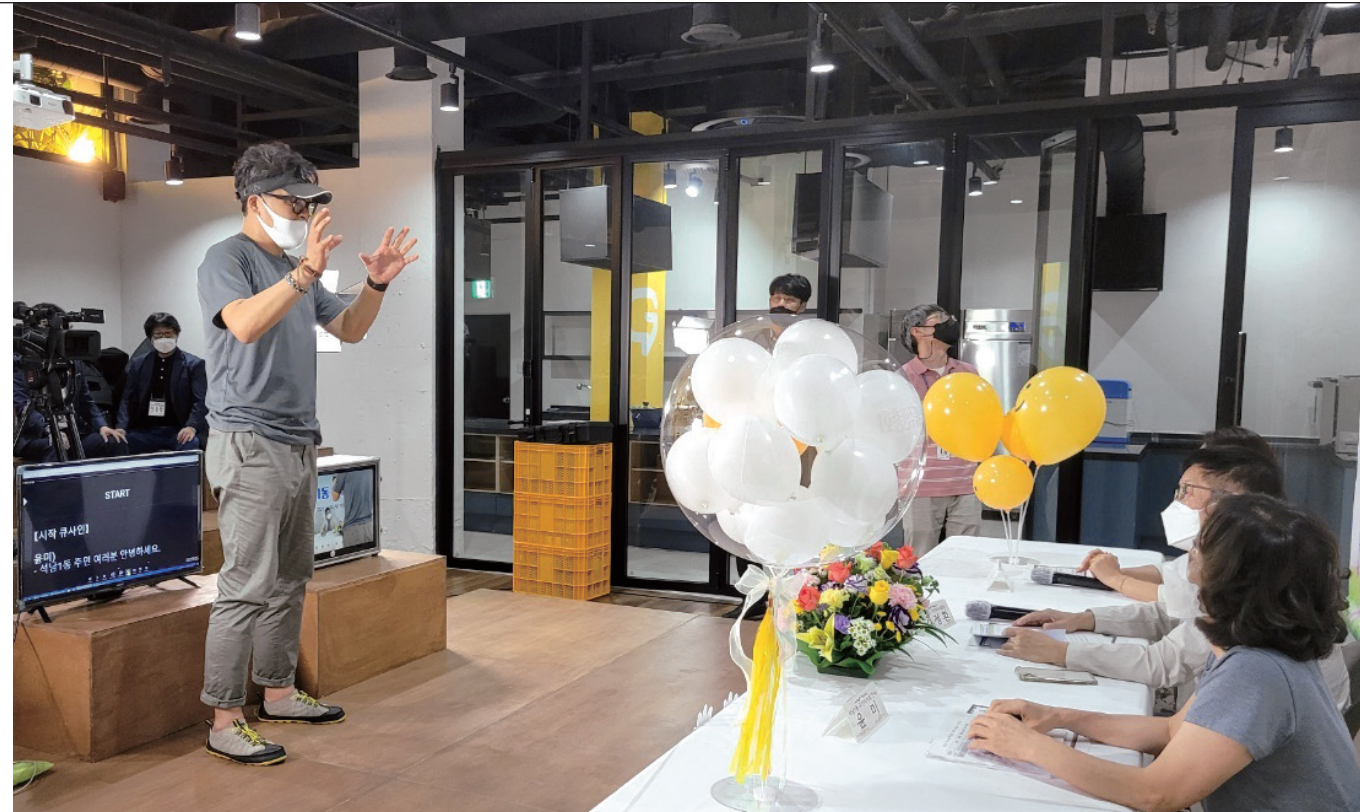
행사 진행 활동 사진