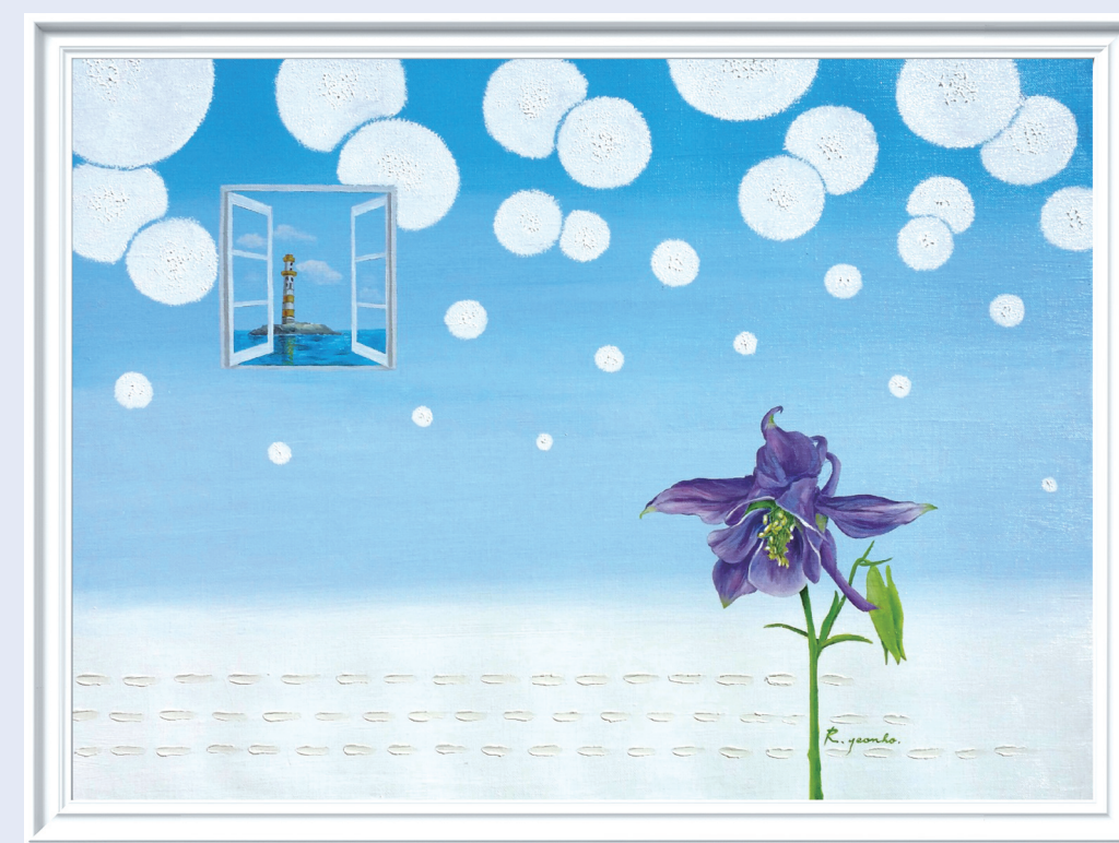
이연호 作 내 영혼의 노래 (10m, Oil on canvas)