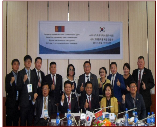
<수호바타르구청장 주재 환영 오찬>