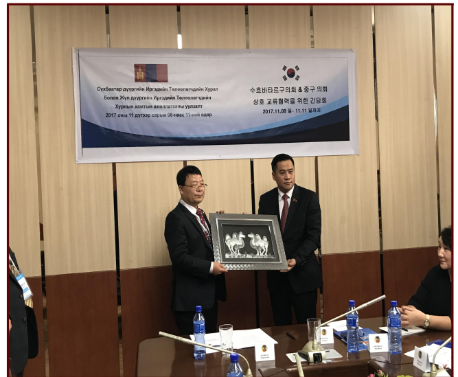
&lt;기념품 교환 및 기념사진 촬영&gt;