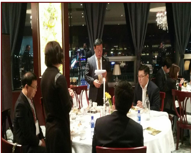
<수호바타르구 의장 주재 환영 만찬>