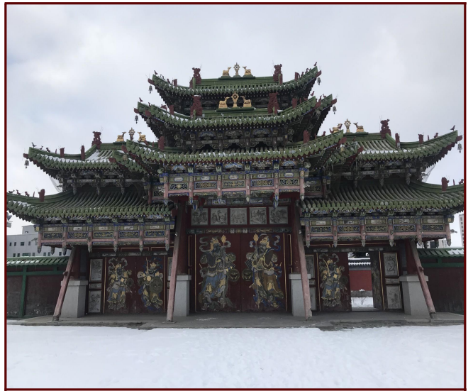
복드 왕 박물관