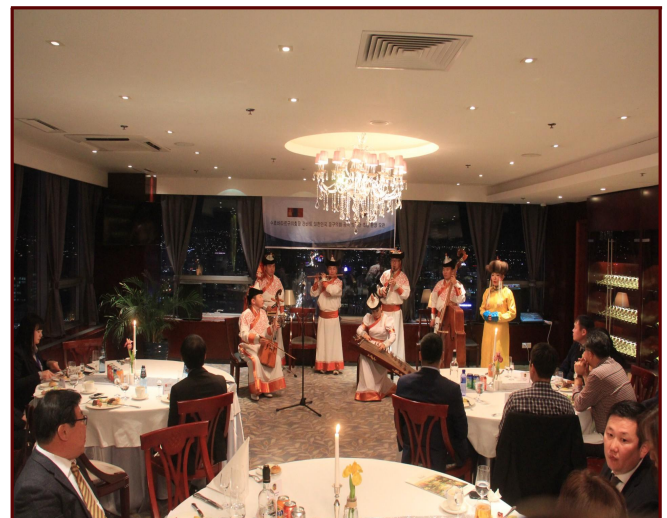
<몽골 전통 공연>