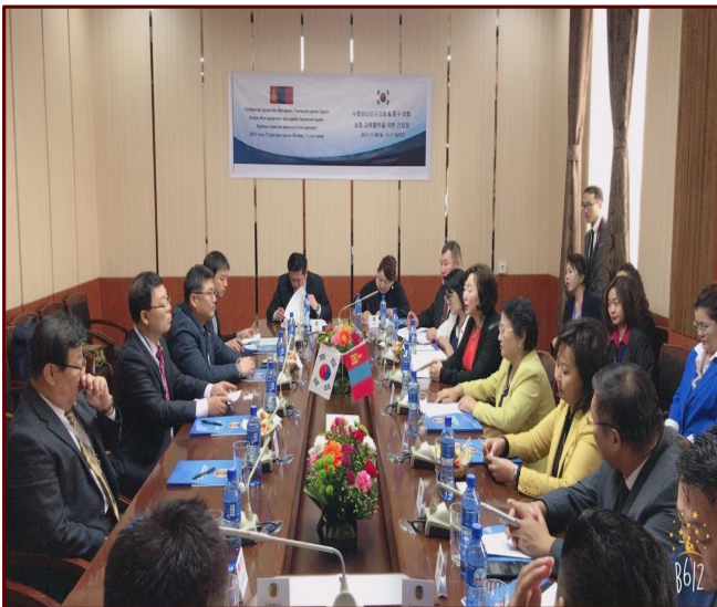
&lt;수흐바타르구 의회 의장 접견&gt;