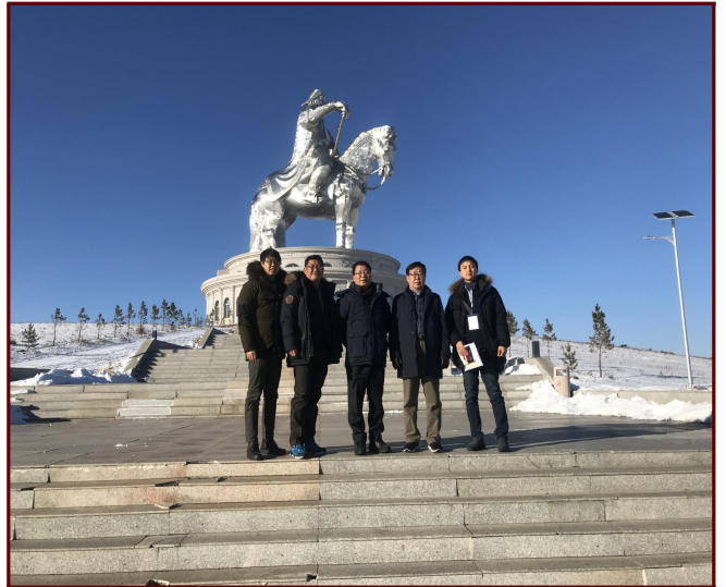
칭기스칸 동상 공원