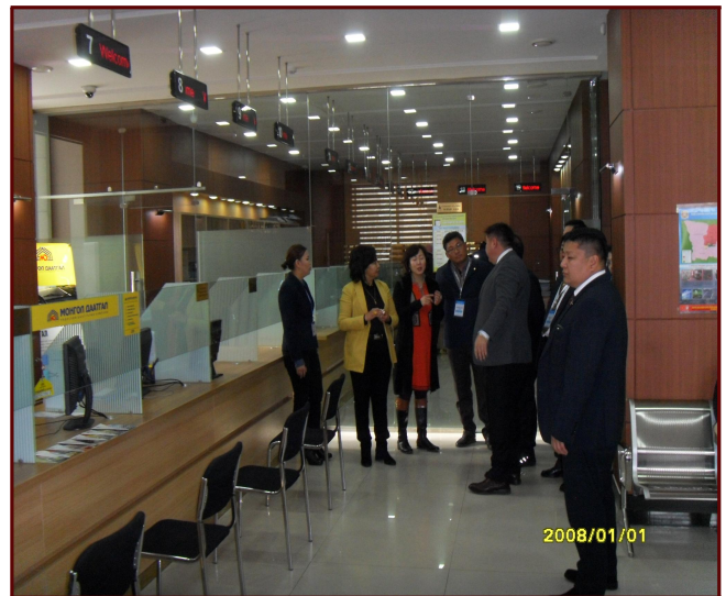
<수흐바타르구 청사 시찰중인 중구의회 방문단>