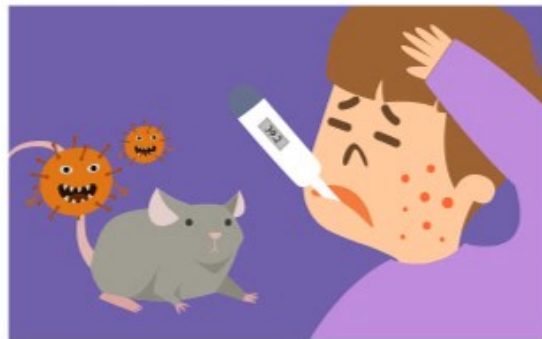
렙토스피라증, 파상풍, 접촉성 피부염