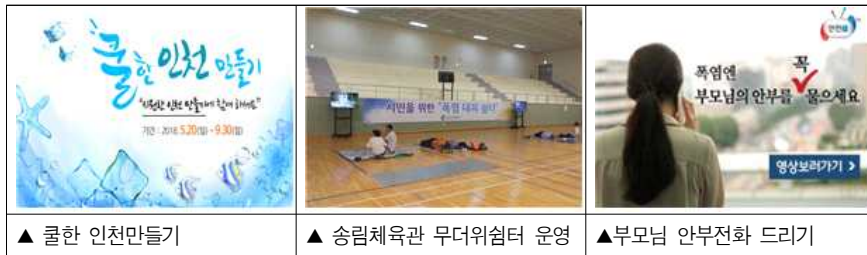
▲ 쿨한 인천만들기