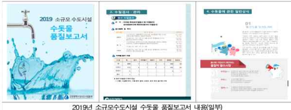
2019년 소규모수도시설 수돗물 품질보고서 내용(일부)

※ 「2019 소규모수도시설 수돗물품질보고서」의 자세한 사항은 인천상수도사업본부 홈페이지 등에서 확인하실 수 있습니다. ( http://waterworksh.incheon.kr )