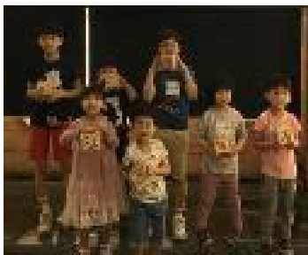
<둘레둘레 식물 탐험대>