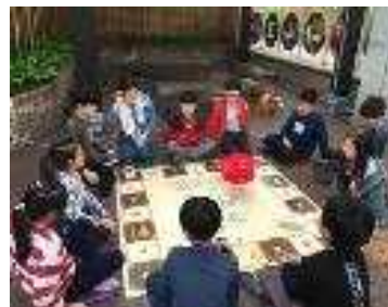
<굴러라! 방방 박물관>