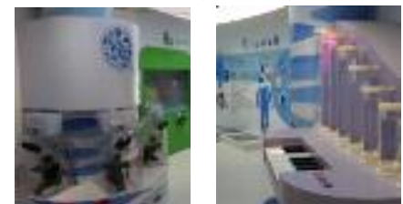
미추홀참물 홍보관 실험 및 체험