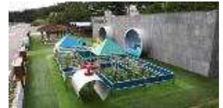
야외 체험시설 (정수처리과정 체험)