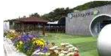
미추홀참물 홍보관 외부 전경