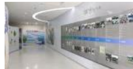
미추홀참물 홍보관 내부 전경