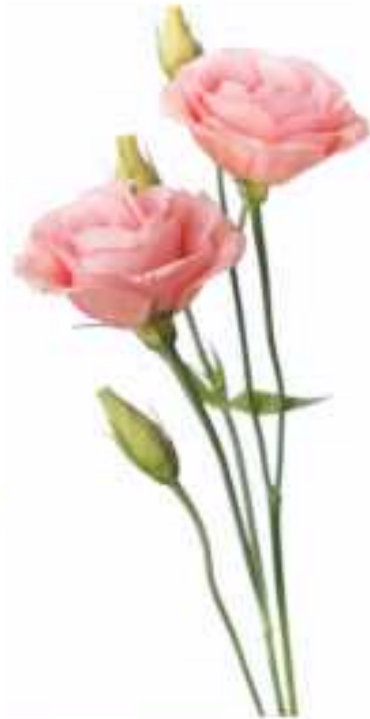
리시안세스(Lisianthus) *가을 햇살* *가을 햇살* *가을 햇살*