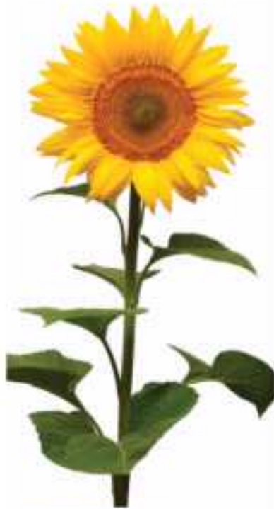
해바라기(Sunflower) *약간 아늑함* *가을 햇살* *가을 햇살*