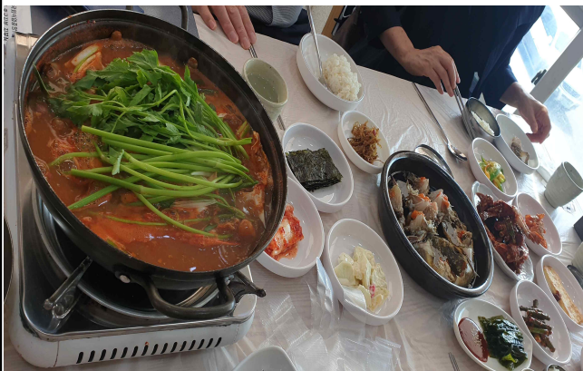
대풍꽃게맛집 / 간장·양념게장, 꽃게탕 세트