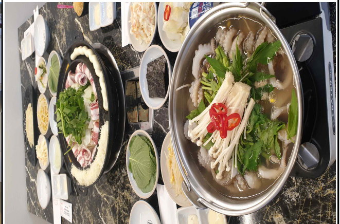
달쭈꾸미 / 우쭈식량