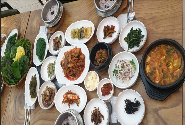
전주맛집 / 우렁제육쌈밥