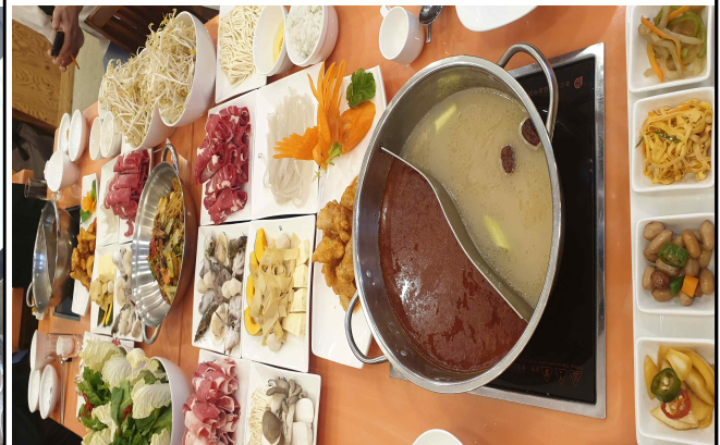
황산샤브샤브 / 뽕귀 세트