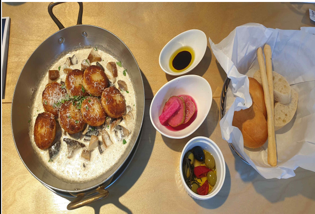
체나콜로 / 뇨끼