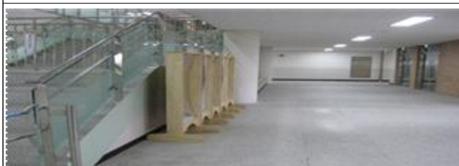
중앙계단 및 복도