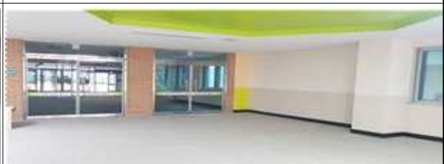
1층 도서관 복도