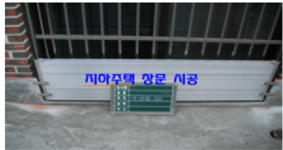
차수판 설치 시공