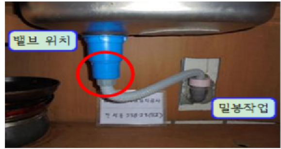
역류밸브 싱크대 시공(후)