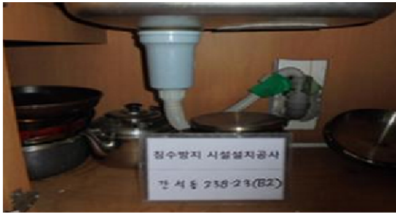
역류밸브 싱크대 시공(전)