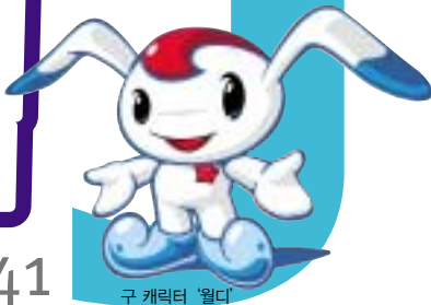
구 캐릭터 '월디'