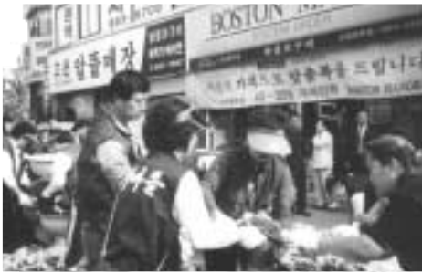
가정, 불우이웃을 위한 김치 담가주기

독거노인, 소년가장 돕기 등 봉사활동 선봉 경로잔치 열고 마을청소, 교통정리에도 앞장