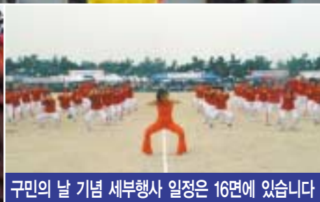
구민의 날 기념 세부행사 일정은 16면에 있습니다