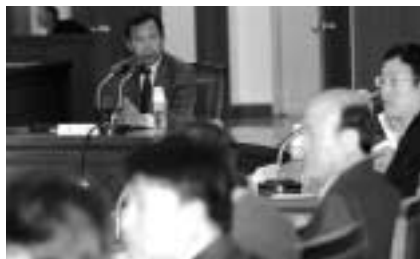
16일 오전 인천지방해양수산청 별관 대회의실에서 열린 인천항 마케팅 전략회의에 참석한 한준규 해수청장이 인사말을 하고 있다.

항만 관련 업계가 회사의 수익과 직결되는 이용료를 깎아주면서 물동량 유치에 나선 것은 국내 항만 가운데 처음이다. 업계는 올해 뿐 아니라 내년에도 목표물량을 설정해 이같은 민간차원의 인센티브를 주기로 했다.