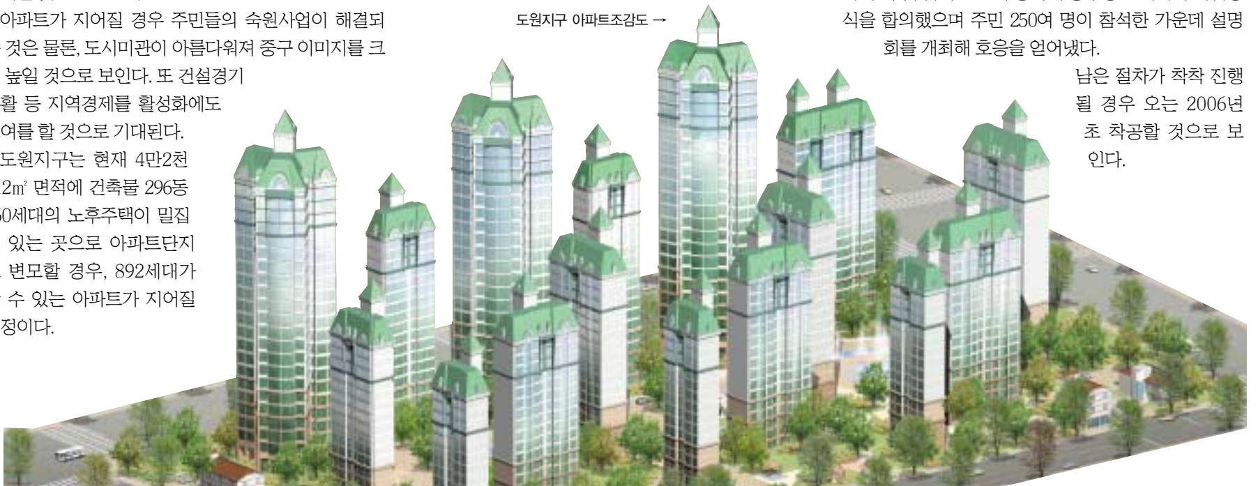
도원지구 아파트조감도 →

남은 절차가 착착 진행될 경우 오는 2006년 초 착공할 것으로 보인다.