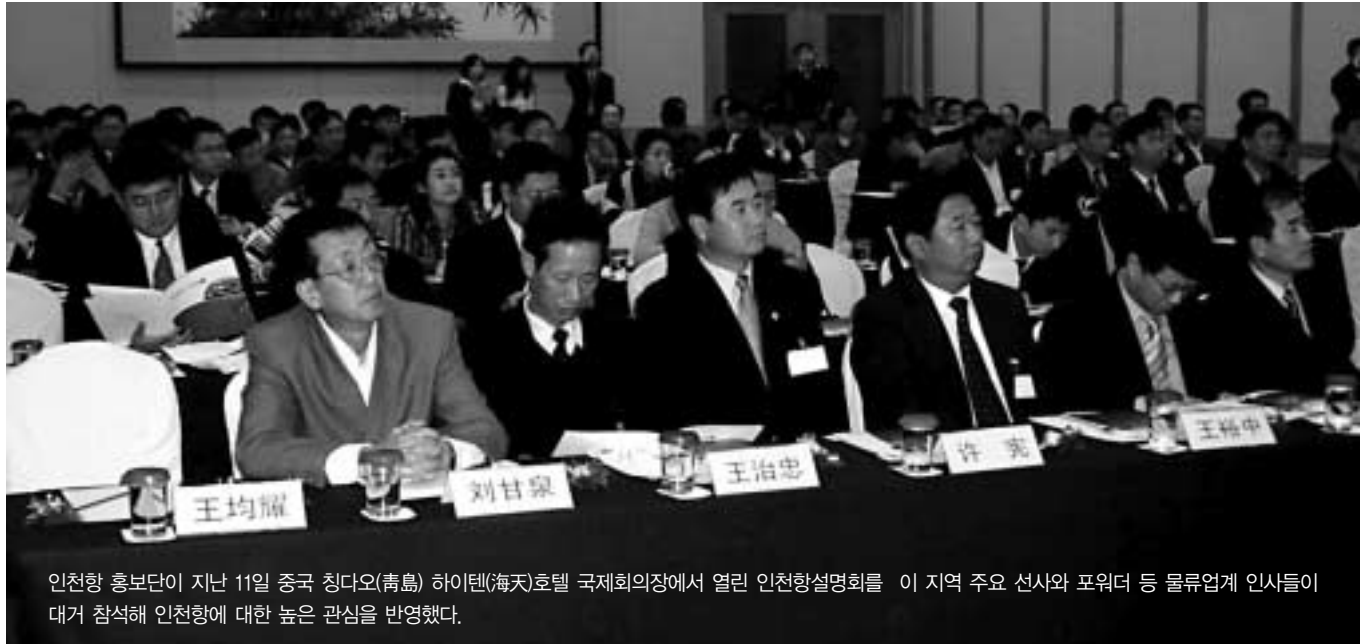
인천항 홍보단이 지난 11일 중국 칭다오(靑島) 하이텐(海天)호텔 국제회의장에서 열린 인천항설명회를 이 지역 주요 선사와 포워더 등 물류업계 인사들이 대거 참석해 인천항에 대한 높은 관심을 반영했다.

이번 홍보활동은 처음 이뤄진 것이 있음에도 불구하고 중국 현지 반응은 기대이상 뜨거웠고, 인천항에 대한 깊은 인상을 심어줬다는 점에서 일단은 성공적이었다는 것이 국내외 관련 업계의 평가다.