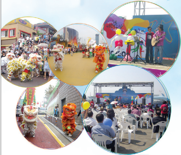
차이나타운 거리예술제 10월 공연일정