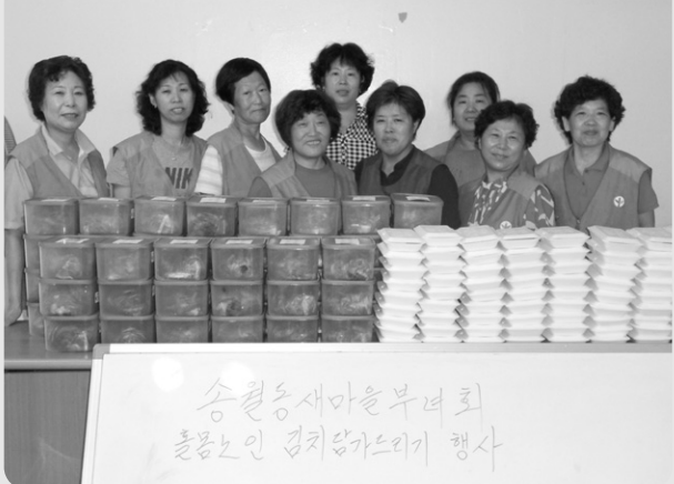
송월동새마을부녀회 홀몸노인 김치담가드리기 행사

송월동 새마을부녀회에서는 매년 명절에 무의탁독거 노인들에게 명절음식들을 정성껏 만들어 제공해 드리고 있다. 새마을부녀회원들은 이 모든 것이 노인 분에게 건강과 기쁨이 되었으면 좋겠고, 앞으로도 계속 이런 도움의 손길을 보내 드렸으면 좋겠다고 소박한 뜻을 밝혔다.