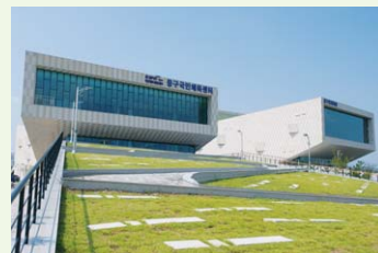
중구 국민체육센터 전경