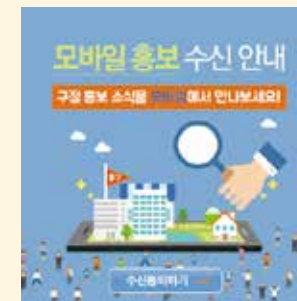
<모바일 홍보 수신 동의 안내>