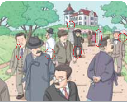
196호 숨은그림찾기 정답