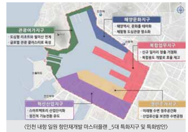
〈인천 내항 일원 항만재개발 마스터플랜 _5대 특화지구 및 특화방안〉