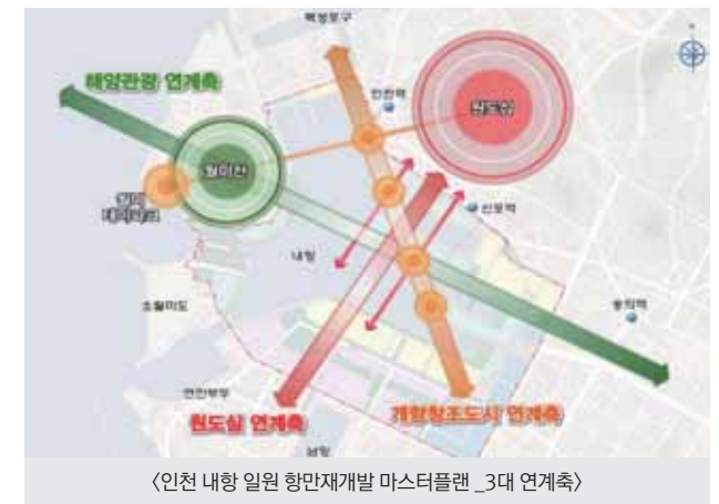
〈인천 내항 일원 항만재개발 마스터플랜 _3대 연계축〉