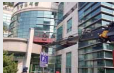
건물 외벽 청소