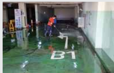
관공서 지하주차장 청소