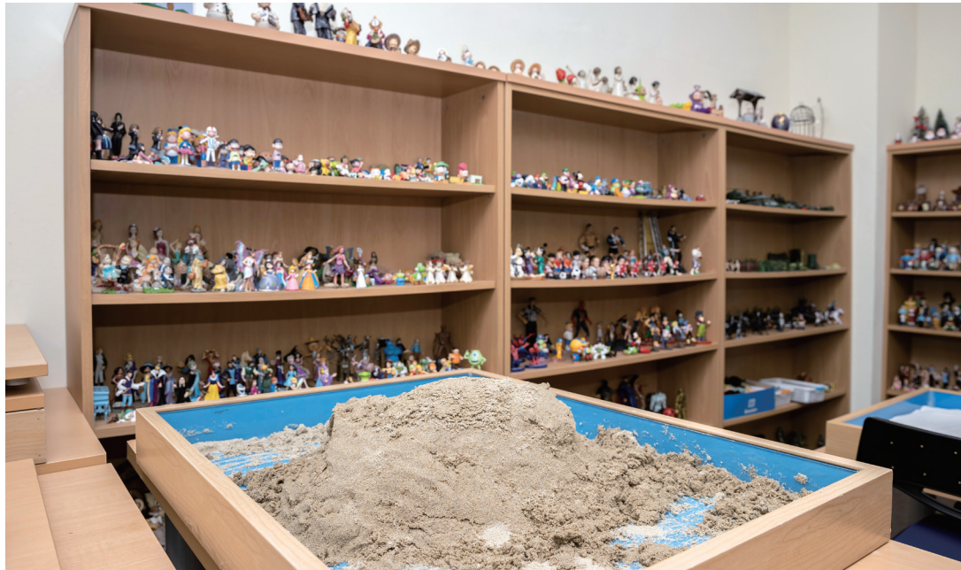
모래놀이 치료 공간