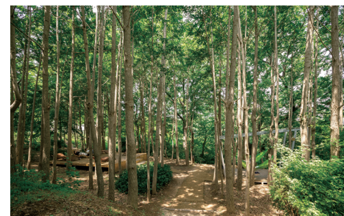
2 숲속 쉼터