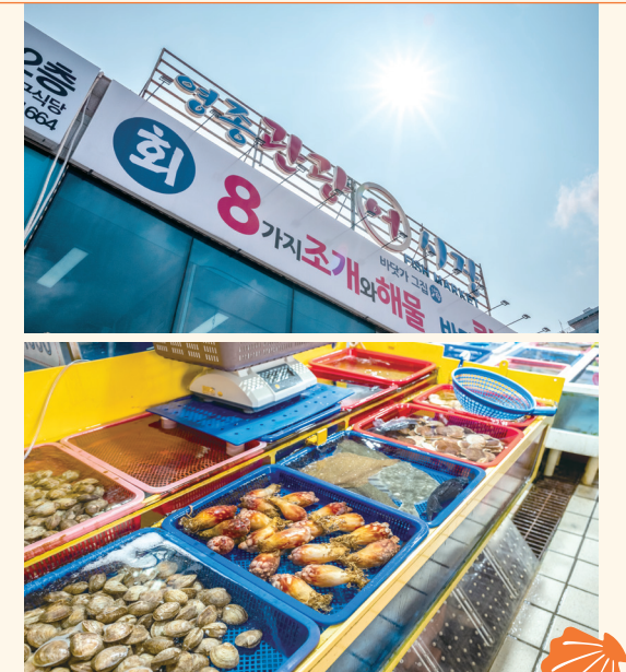
주소 인천 중구 은하수로 3

영종관광어시장의 가장 큰 매력은 제철 생선을 저렴하게 구매할 수 있다는 점이다. 살이 통통하게 오른 대게, 랍스터, 킹크랩 등을 전문으로 파는 가게도 있다. 2층에선 밑에서 고른 횡감과 생선찜, 비빔밥, 생선탕, 칼국수 등 각종 식사 메뉴가 있어 맛있는 한 끼를 즐길 수 있다. 또한 탁 트인 바다 풍경을 감상하며 신선한 회를 맛볼 수 있는 곳으로 유명하다. 시장 주변에 호텔이 다수 있어 관광객들이 많이 방문한다.