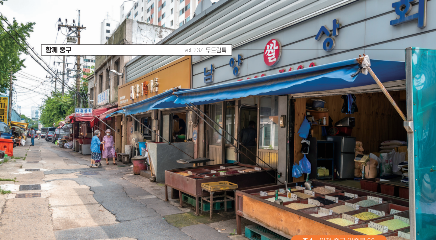
주소 인천 중구 인종로 63