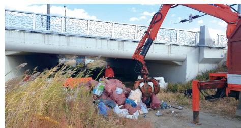
폐기물 도로 청소

취약계층에게 사회서비스 또는 일자리를 제공하거나 지역사회에 공헌함으로써 주민의 삶의 질을 높이는 등 사회적 목적 추구와 재화 및 서비스의 생산·판매 등 영업활동을 하는 기업을 말한다.